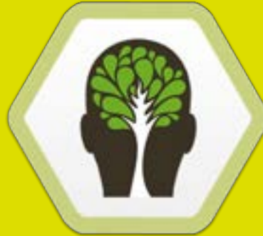
Stimuleren van innovatie